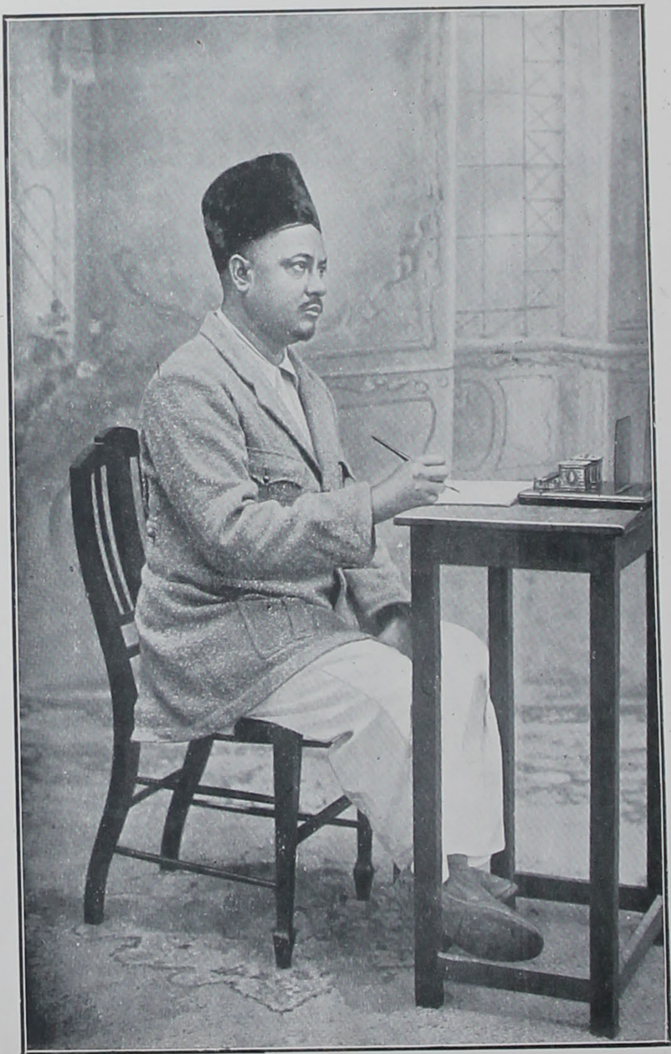
مولانا سيد نظام الدين راغب (بلبل بنگالہ)