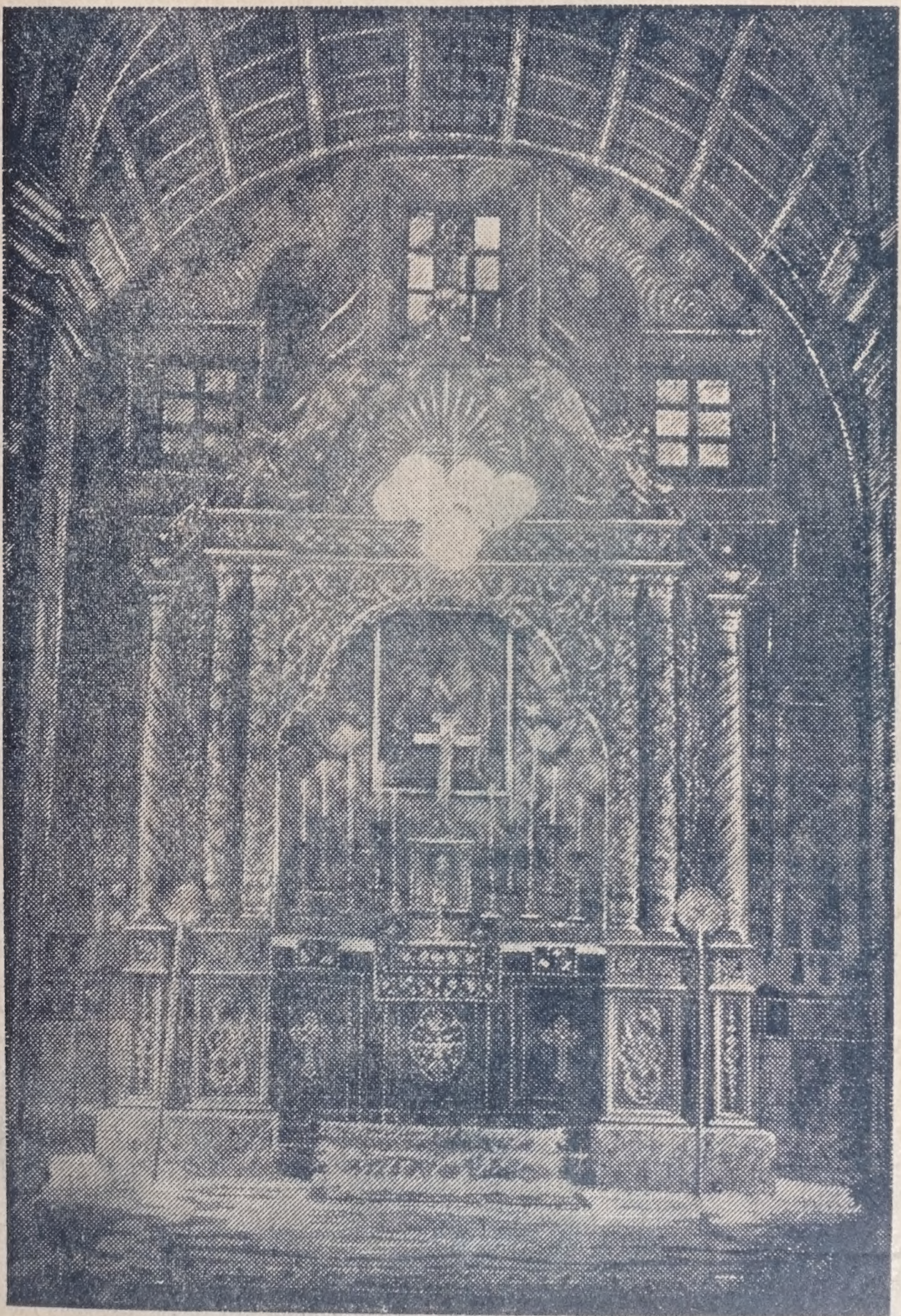
കോട്ടയം പഴയ സിമ്മനാരി ചാപ്പലിന്റെ മദ്രാസഹായകം

പുസ്തകം 3 | 1949 സെപ്റ്റംബർ * ഖിത്താബ് 1125 | ലക്കം 11