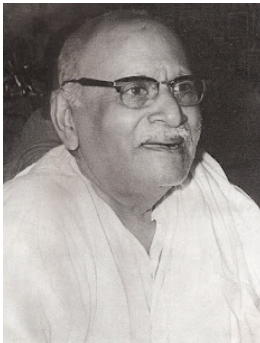
परम पुण्य काईजी श्रीदुष्काप्रभारती योग्य